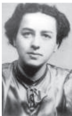
Tswi's moeder werd omgebracht toen ze 24 jaar was.