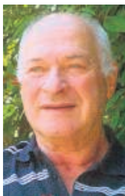
Tswi Herschel.